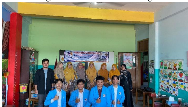
Gambar 2. Foto bersama guru-guru RA Al Itroh Ath Thohiroh dan tim PkM

Sesi terakhir diisi dengan tanya jawab, di mana peserta dapat mengajukan pertanyaan terkait materi. Kegiatan diakhiri dengan sesi foto bersama sebagai dokumentasi.